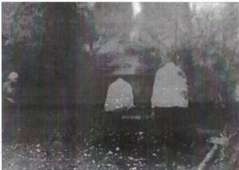
Поступление раненых в медико-санитарный батальон, 1942 г.