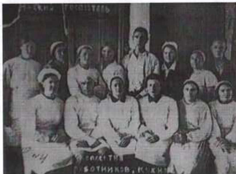
Работники кухни эвакогоспиталя № 3879