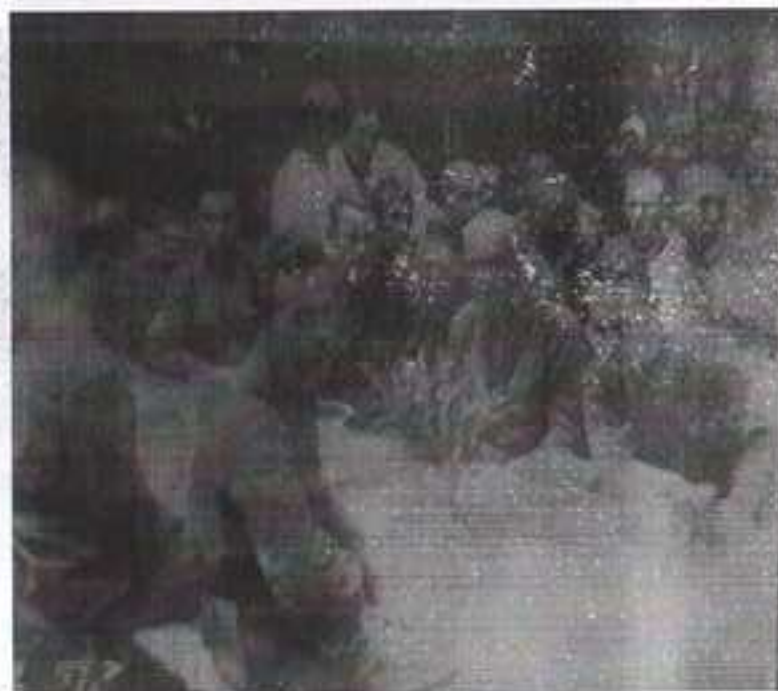
Обед в эвакогоспитале