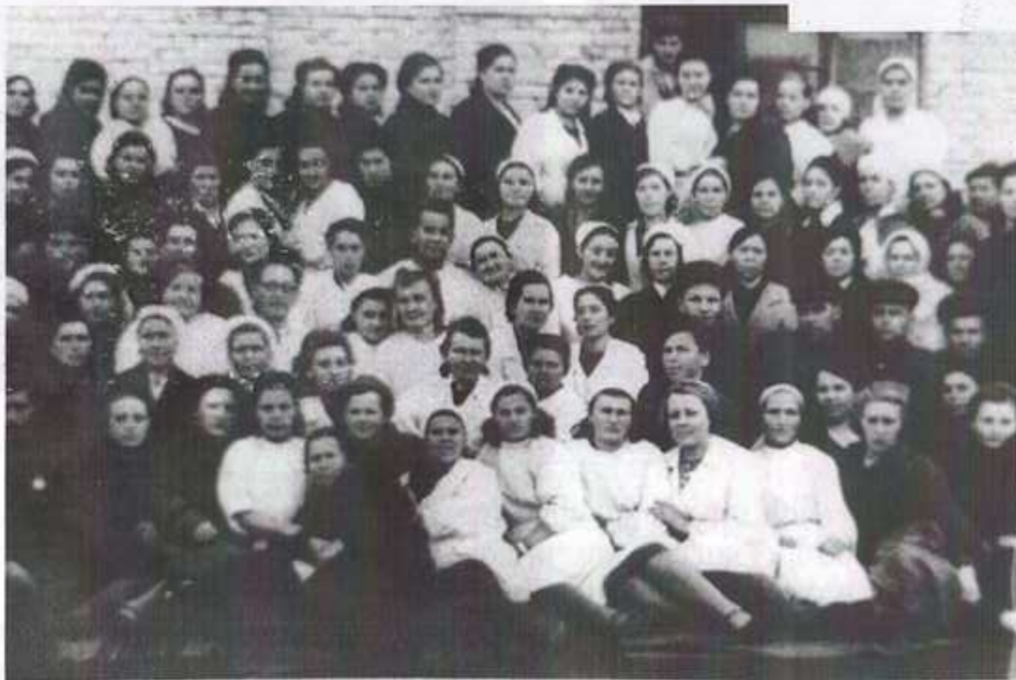
Коллектив эвакогоспиталя № 3879

В годы войны приходилось работать на износ. Медицинская сестра была и перевязочной сестрой в процедурной, массажистом и няней. Весь медицинский персонал сдавал кровь. Помимо дежурства выполнял и другие работы, ездил на заготовку дров. И никогда они не пасовали перед трудностями, жили открыто, дружно и с настроением. Поэтому успевали многое.