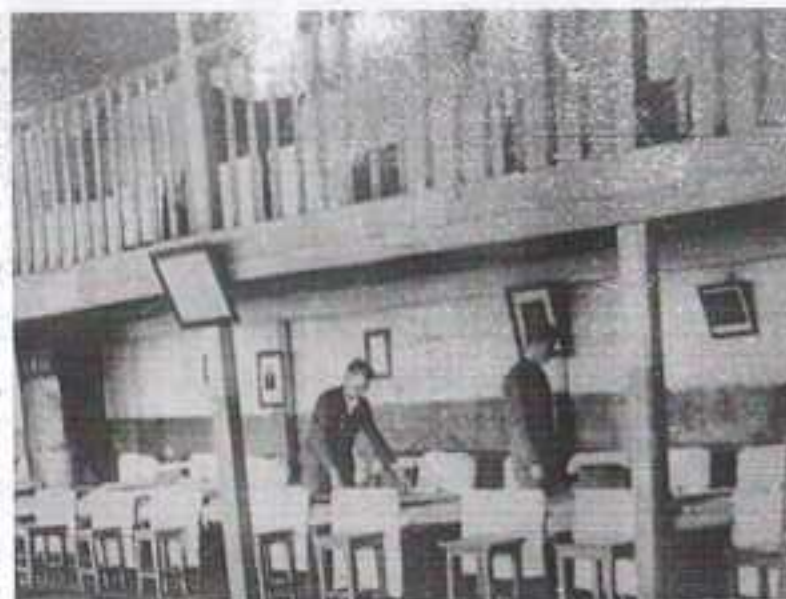
Столовая эвакогоспиталя № 3879