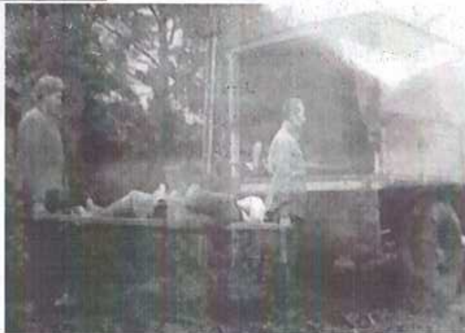
Погрузка раненых бойцов в медико-санитарный батальон, 1942г.